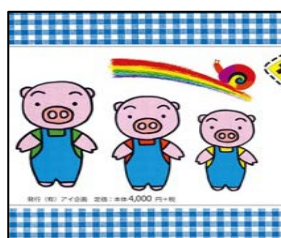
『3びきのこぶた号』『にんじんさん・ごぼうさん・だいこんさん』

貸出し備品にパネルシアター“3びきのこぶた号” “にんじんさん・ごぼうさん・だいこんさん” が加わりました。ぜひご活用ください。